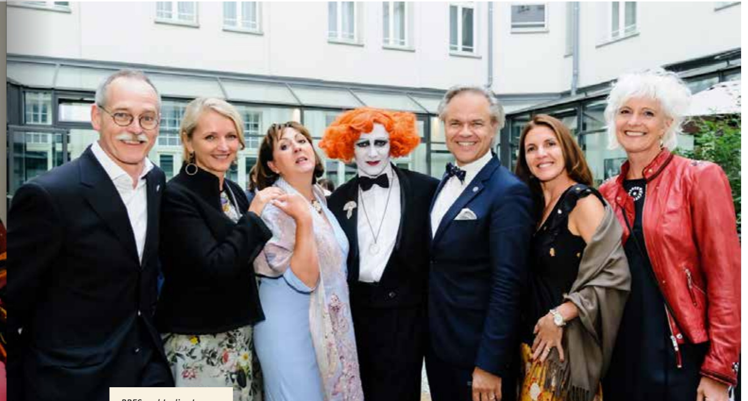
RREC and Ladies Lounge